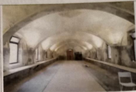
▲ Le immagini Nella foto grande l'affresco della Madonna con bambino; nelle piccole l'interno e l'esterno della Cascina San Romano, cuore di Boscoincittà